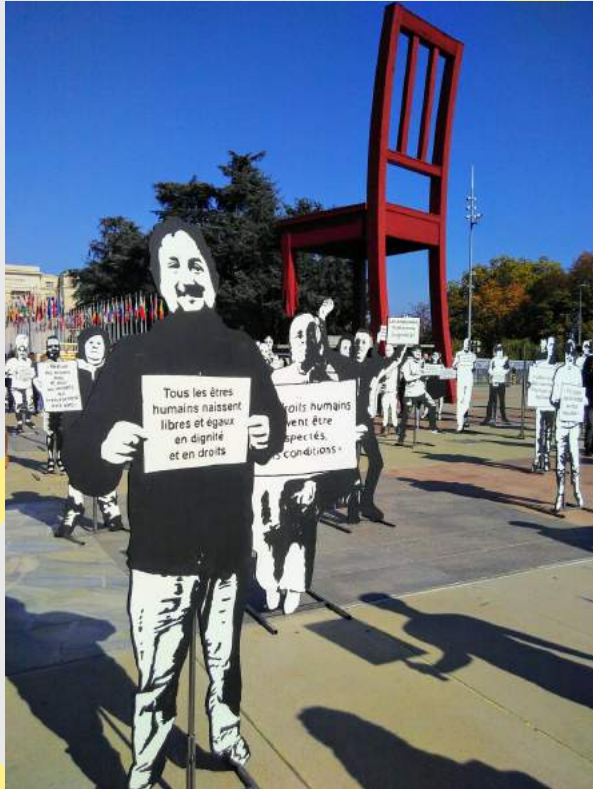
2015 Place des Nations